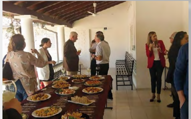
Feria de las FFAA 25 de Julio