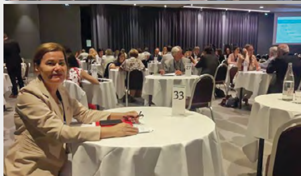
Noche de Vinos y Quesos 11 de Junio