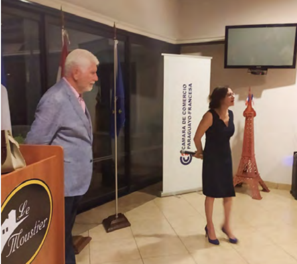
Brindis de Fin de Año 6 de Noviembre