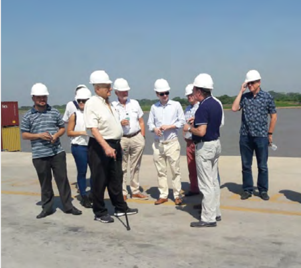
Visita a Terport Villeta 2 de Noviembre